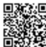
Richieste di inserimento in classifica