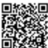
Modulo di protesta

Avviso: Questo albo digitale dei comunicati rappresenta l'Albo Ufficiale dei Comunicati (AUC) per questa regata.