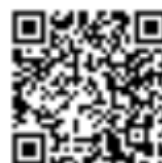
Invia richiesta di inserimento in classifica

AVVISO: Quando si invia una protesta, una richiesta o un rapporto, la procedura rimane invariata (come da Regole di Regata e Istruzioni di Regata).